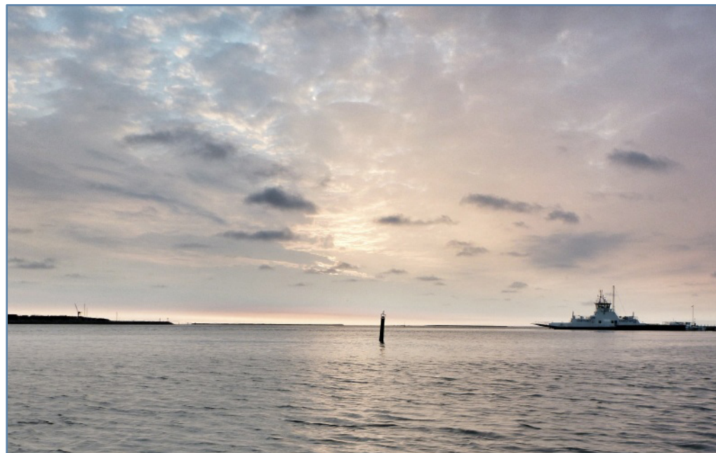
Folderen er blevet til i samarbejde med Randers Fjord Fritidsfiskerforening og Fiskeristyrelsen

Vær opmærksom på at den til enhver tid gældende fiskerilovgivning, også omfatter fiskeri i Randers Fjord!