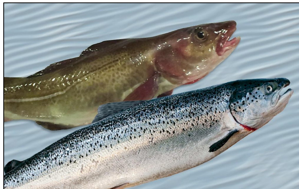
Fangstbegrænsning på torsk og laks i Østersøen. Gældende for det rekreative fiskeri i 2022.

Har du yderligere spørgsmål vedrørende gældende regler for lyst- eller fritidsfiskeri, er du velkommen til at kontakte Fiskeristyrelsens fiskerikontrol på tlf.nr.: +45 7218 5600