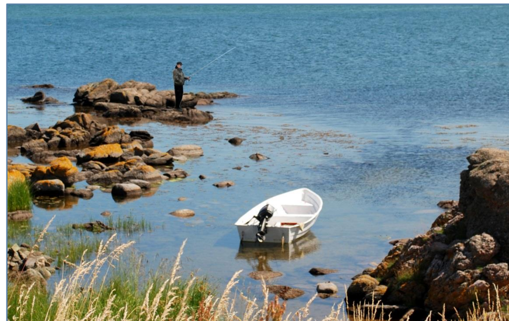
Folderen er blevet till i samarbejde med Dansk Amatørfiskerforening Bornholm, Bornholms Sportsfiskerforening og Fiskeristyrelsen.

Vær opmærksom på at den til enhver tid gældende fiskerilovgivning, også omfatter fiskeri ved Bornholm og Christiansø!